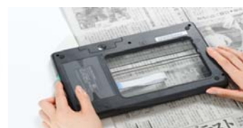
反転シースルースキャン

ToRiZo は思い出のこもった写真のデジタル化に最適なスキャナとして次の 5 つの特長をもつ商品として市場導入し、お客様のご好評をいただいております。