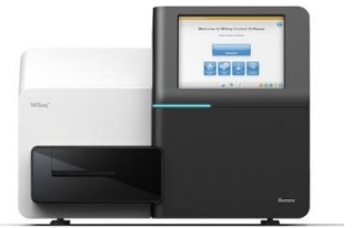
▲腸内フローラ解析装置

その結果、肉食女子は、「腸内環境の状態をあらわす指標」のうち、善玉菌として一般的に知られているビフィズス菌や乳酸菌、フィーカリ菌などのおなかのバランスを整える菌を指す「 バランス調整菌 」の数が 少ない傾向にある ことが判明。同世代女子（ウンログユーザー20～30代女性）では「バランス調整菌」の割合が平均24%でしたが、肉食女子の場合は平均20%と、4ポイントの差が生じています。