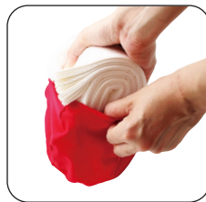
ティッシュペーパーを折り曲げて本体にセットする。

パウダービーズクッションのメーカー株式会社MOGUが生み出したティッシュケースはクッションと同じ伸縮性生地と少量のパウダービーズを用いた袋状のティッシュケースで、市販のBOXティッシュを2つ折りにし、開口部を広げて収納するだけのシンプルな仕様です。