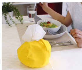
普段は自宅で使用し、必要な時に持ち出せる

一方、MOGUティッシュケースは軽くてやわらかコンパクト、さらに1箱分のティッシュ約150組を収納し、少量になるにつれ小さくなるので、家庭で使いながら必要な時に持ち出せる事が出来る商品です。BOXを必要としないので、ビニールパックティッシュに替えることで、経済的でゴミも減らすことができます。汚れた際は洗濯可能です。