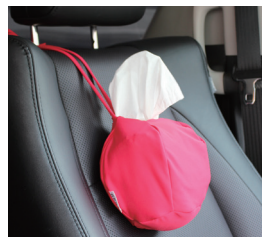
伸縮性生地によって、ティッシュペーパーの量に応じて小さくなる