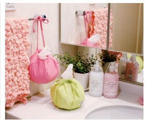
内側の吊り下げ紐を使用すればさまざまなシーンで使いやすい