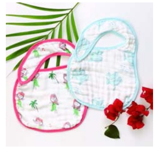
ビブ&パープクロスセット

Coco Moon 公式サイト でも本日より販売スタートしています。あわせてご覧くださいませ。