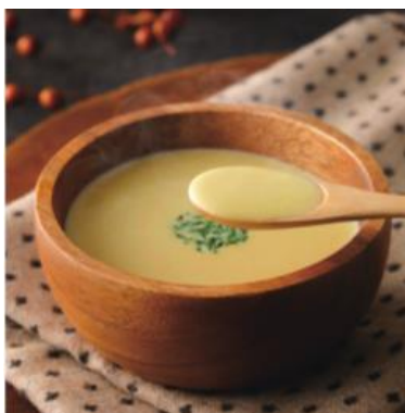
農薬や化学肥料を使わず、甘みも食感も100%完熟コーン SWEET CORN SOUP/ (株) 岡本農園

■素材よし、風味よし、アイデア多彩な加工食品。ひと手間・ふた手間加えた、より付加価値の高い北海道グルメが登場します。