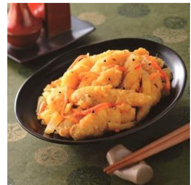
鮮度感を楽しめる北方系の白身魚を使った北海道ならではのつまみ エノメ/ 丸南産責/ (株) マキシム