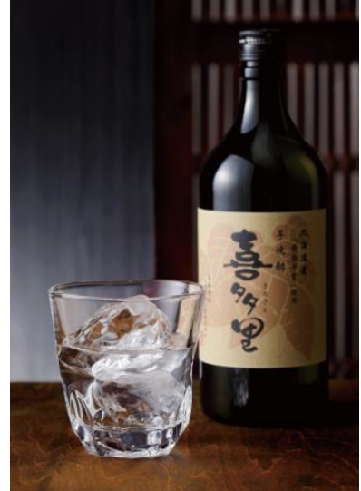
原料づくりから挑み、成功した北海道らしいクリアな味わいの本格芋焼酎 本格芋焼酎喜多里25%/札幌醗酵工業(株)