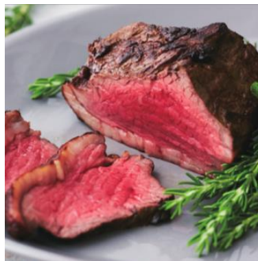
17種類のハーブを与え、大自然の恵みを受けてゆっくり育った国産牛十勝ハーブ牛/ (株) ノベルズ