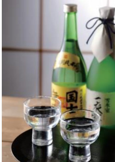
“しばれる”冬の寒さの中で人の手や圧力を一切かけず、一夜かけて滴る雫を集めたお酒 大吟醸青雫雪氷室一夜雫/高砂酒造(株)