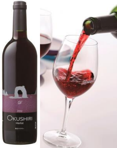
日本海の潮風を受けて育ったぶどうで作った、潮の香りを余韻に残す熟成ワイン 奥尻ワイン/(株)奥尻ワイナリー

■近年高く評価されている北海道産のワインと日本酒。ワインの原料となるブドウの生産量は日本一を誇り、現在は 23 ヲ所のワイナリーが誕生し個性的なワインを生産しています。また、北海道の日本酒の酒蔵は現在 14 ヲ所。厳しい寒さを生かした寒仕込みの酒や、四季醸造で造る季節の酒など、酒蔵ごとの魅力がよりはっきりとし、それぞれの個性が光る日本酒造りが盛んになっています。