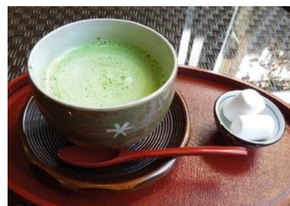
冬におすすめの宇治抹茶オレ (500円税込)

cafe & gallery 仁右衛門 【住所】〒321-1405 栃木県日光市石屋町 418-1 【TEL】0288-54-0382 【HP】http://www.niemon.net/ 【営業時間】10:00～18:00 (L.O17:00) 【定休日】水曜、第2・4木曜 【アクセス】東武日光駅から東照宮方面へ向かって徒歩5分