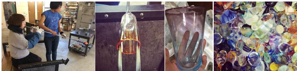
息を入れてガラス玉を膨らませる

溶解炉から溶けたガラスを吹き竿に巻き付け、色や泡を付けた後、くるくると回転させながら息を入れて、形を作っていきます。吹きガラス体験の方には、日光駅や、お泊りの施設まで無料の送迎付き。電車でお越しの方も安心してお楽しみいただけます。