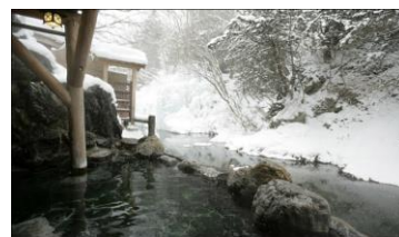
川のせせらぎと雪景色がたのしめる

日光国立公園 本家伴久(にっこうこくりつこうえんほんけばんきゅう) 【住所】〒321-2601 栃木県日光市湯西川温泉 749 【TEL】0288-98-0011 【HP】 http://www.bankyu.co.jp/about/ 【営業時間】8:00～20:30 【定休日】年中無休 【アクセス】東武鬼怒川線、野岩鉄道、会津鬼怒川線湯西川温泉駅より、東武ダイヤルバスで20分