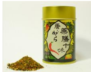
薬膳十味唐辛子(870円税込)