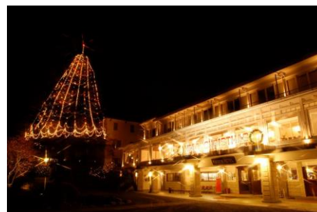
日光金谷ホテルのクリスマスイルミネーション

東京から電車で約2時間。都心から一番近い世界遺産「日光の社寺」エリアで冬を楽しみながら、今年1年を締めくくり、新しい1年をスタートさせる旅はいかがでしょう。