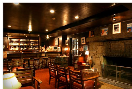
寒い夜は暖炉のあるバーで一杯

バーデイサイト(日光金谷ホテル内) 【住所】〒321-1401 栃木県日光市上鉢石町 1300 【TEL】0288-54-0001 【HP】 http://kanayahotel.co.jp/index.html 【営業時間】18:00～22:30 【アクセス】JR日光、東武日光駅前より「奥細尾・中禅寺温泉・湯元温泉行」のバス約5分、「神橋(しんきょう)」バス停車