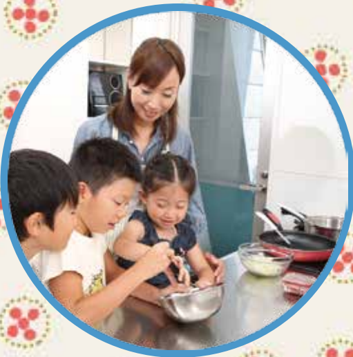
ゆう て 夕飯の手つだいをしたり

みんなでいっしょに美味しいごはんを食べにおいでよ! たの うれいしー 楽しいー 幸せごはん♪ しあわ