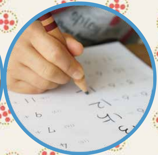
しゅくだい 宿題をしたり