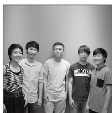
Practical Design Studio