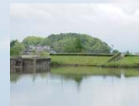
水鳥公園 (徒歩約7分/約500m)