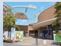
牧の原モア (車約8分/約3,170m)

北千葉道路の印旛～成田区間の工事が完成することによりカーアクセスもさらに充実。また、総合病院の建設が完成し、JR「小林」駅のリニューアルも進行で、今後さらに快適な住環境に向けて発展が期待されるエリアです。