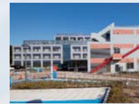
印西総合病院 (車約7分/約2,870m)

※距離表示については地図上の概測距離を、徒歩分数表示については80mを1分として算出(端数切り上げ)したものです。※車による所要時間は地図上の概測距離を、時速24km、または1分400mで走行した場合の換算です。※本分譲地販売センターからの概測距離になります。