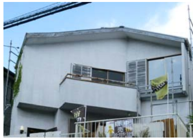
▲BEFORE 東永谷ギャラリー外観

ギャラリー住所 : 横浜市港南区東永谷 2-7-14 公開期間 : 2015年2月7日(土) ~ 約1年間 リノベーション費用 : 約2,000万円 物件築年数 : 33年 家族設定 : 30代前半の若夫婦+お子様1人 設計デザイン : Rstudio (ミッドフォーム事業部)