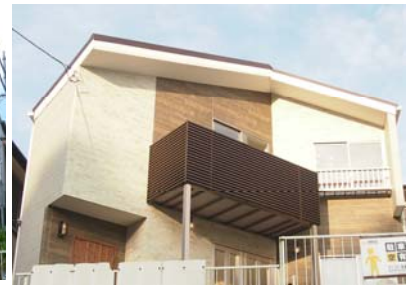
▲AFTER 東永谷ギャラリー外観