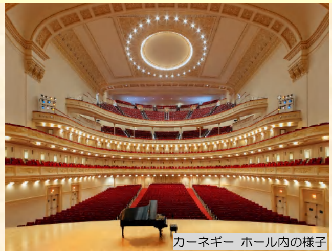
カーネギー ホール内の様子