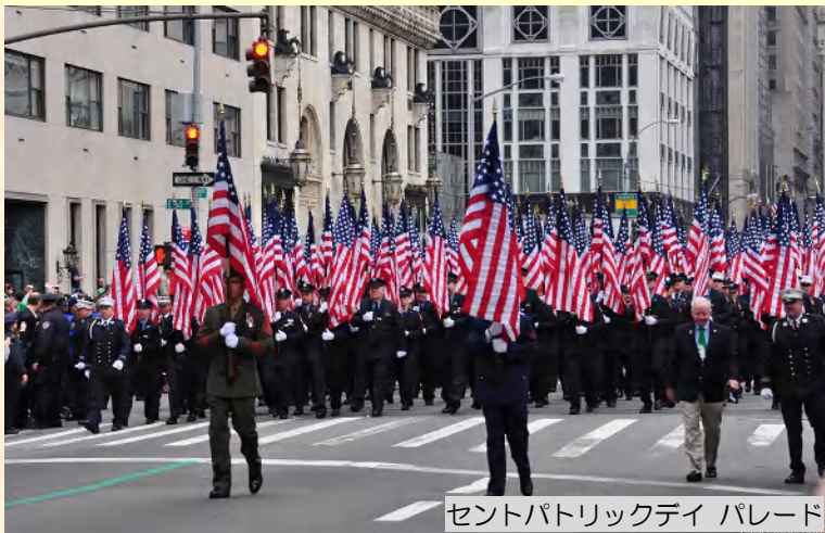
セントパトリックデー パレード