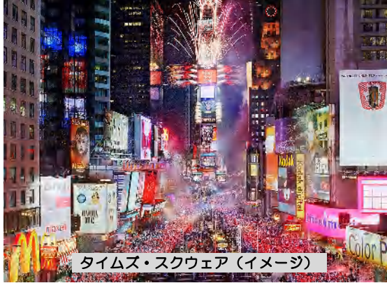
タイムズ・スクウェア (イメージ)