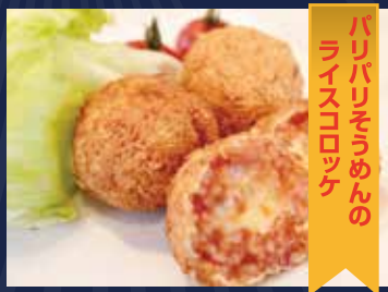
バリバリそうめんのライスコロッケ