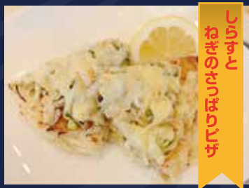
しらたひのおせのひんじ