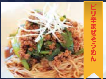
ピリ辛ませそうめん