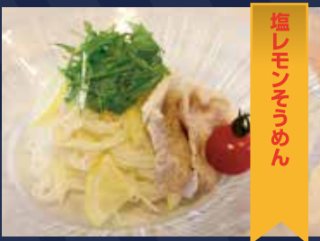
塩レモンそうめん