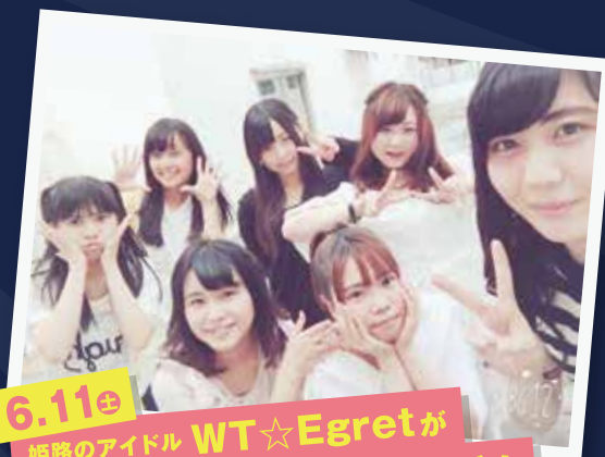
6.11(土) 姫路のアイドル WT☆Egretが応援にやって来る!