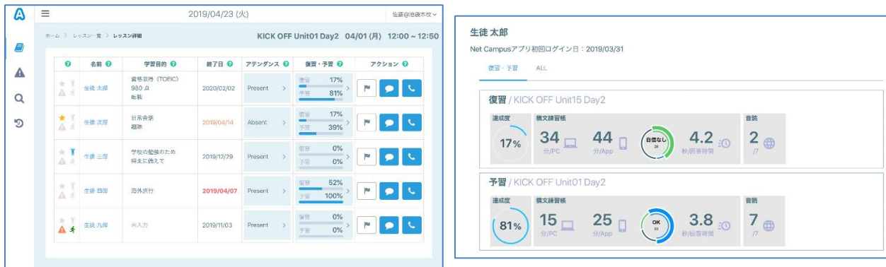
生徒の学習目的や進捗状況一覧

英会話教室を運営するイーオン、KDDI、および KDDI デジタルデザインは、教育と ICT を組み合わせた「EdTech」を推進する共同プロジェクト「イーオン デジタルトランスフォーメーション AEON DX」（以下「AEON DX」（注1））第2弾として、生徒の自宅学習状況やスクールでのレッスンの進捗などをデータベース化し、取得したデータの分析結果に基づきレッスンやカウンセリングを生徒個別に最適化する「AEON NOTE」を全国スクール（注2）に、2019年5月13日より導入します。