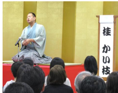
前回の「英語落語会」の様子

イーオンは、今後も英語学習の多様化するニーズに応え、より充実した英語教育の提供に努めてまいります。