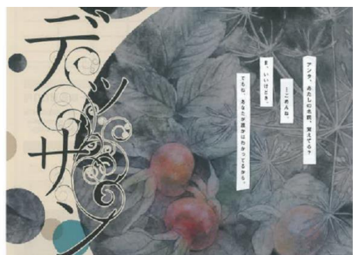
SPIRAL MOON 「デッサン」