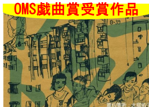
ニットキャップシアター 「ヒラカタ・ノート」