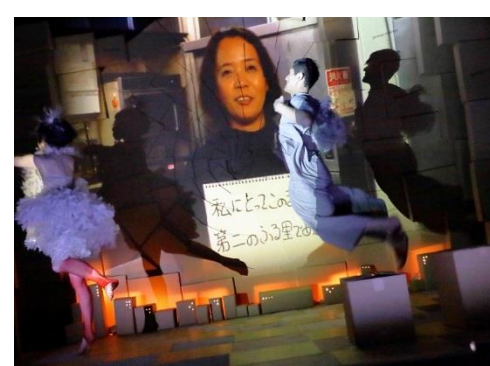
極東退屈道場 「ガベコレ-garbage collection」「タイムズ」