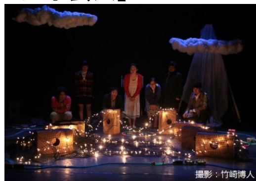
ニットキャップシアター 「ピラカタ・ノート」