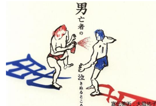
ニットキャップシアター 「男亡者の泣きぬるところ」