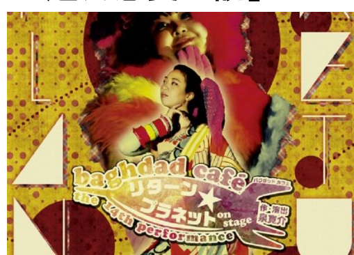
Baghdad cafe 「リターンプラネット」