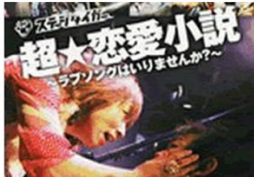
ステージタイガー 「超☆恋愛小説」