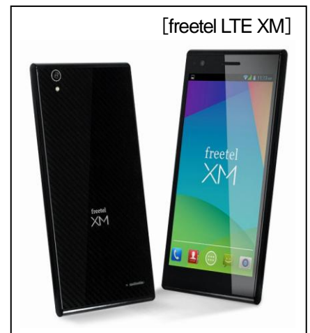
[freetel LTE XM]

この「freetel LTE XM(フリーテル LTE XM)」も、現在、全国家電量販店や各オンラインショップで、絶賛予約受付中です。