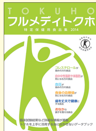
地域生活者用データブック「フルメディトクホ」

「フルメディトクホ」は医療従事者用「フルメディトクホプロ」に比べて要点を分かりやすくまとめた内容となっています。持ち運びに便利なコンパクトサイズに仕上がっており必要な方へ配布していただくことを目的とした情報誌です。希望部数を医療従事者の皆様へ無料でお届けします。