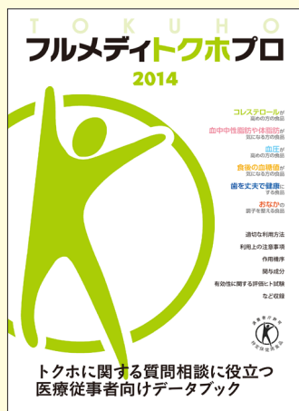
医療従事者用データブック「フルメディトクホプロ」

「フルメディトクホプロ」は医療従事者の皆様が常備し、トクホに関する質問や相談があった際に活用していただくことを目的とした情報誌です。全国の健診、予防分野の医療機関、行政機関を通じて主に医師、歯科医師、薬剤師、管理栄養士(栄養士も含む)、保健師の皆様へ無料でお届けします。