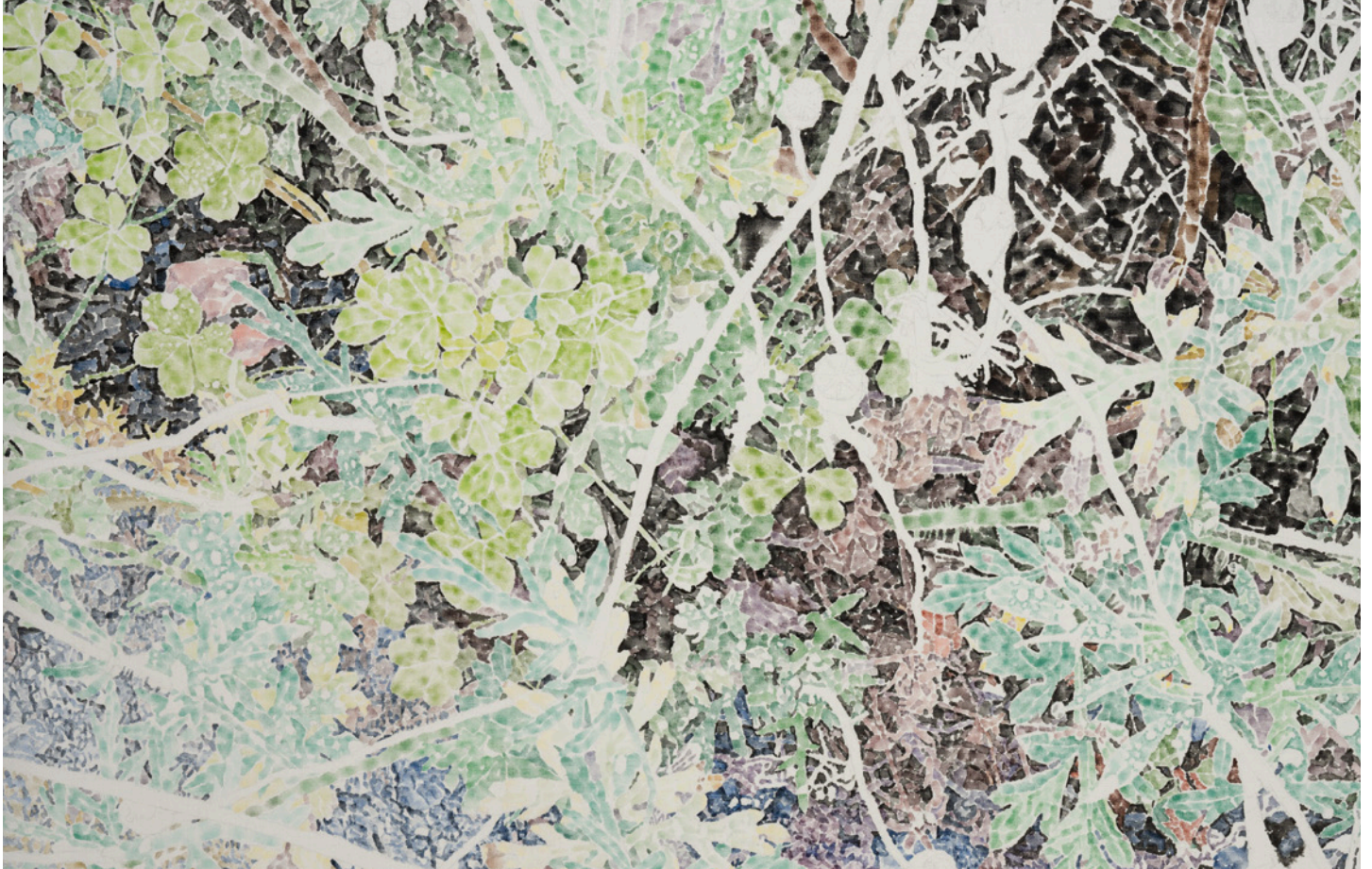
“駐車場と道路の間 雨の日” 2022年 油彩、キャンパス 112×145.5cm