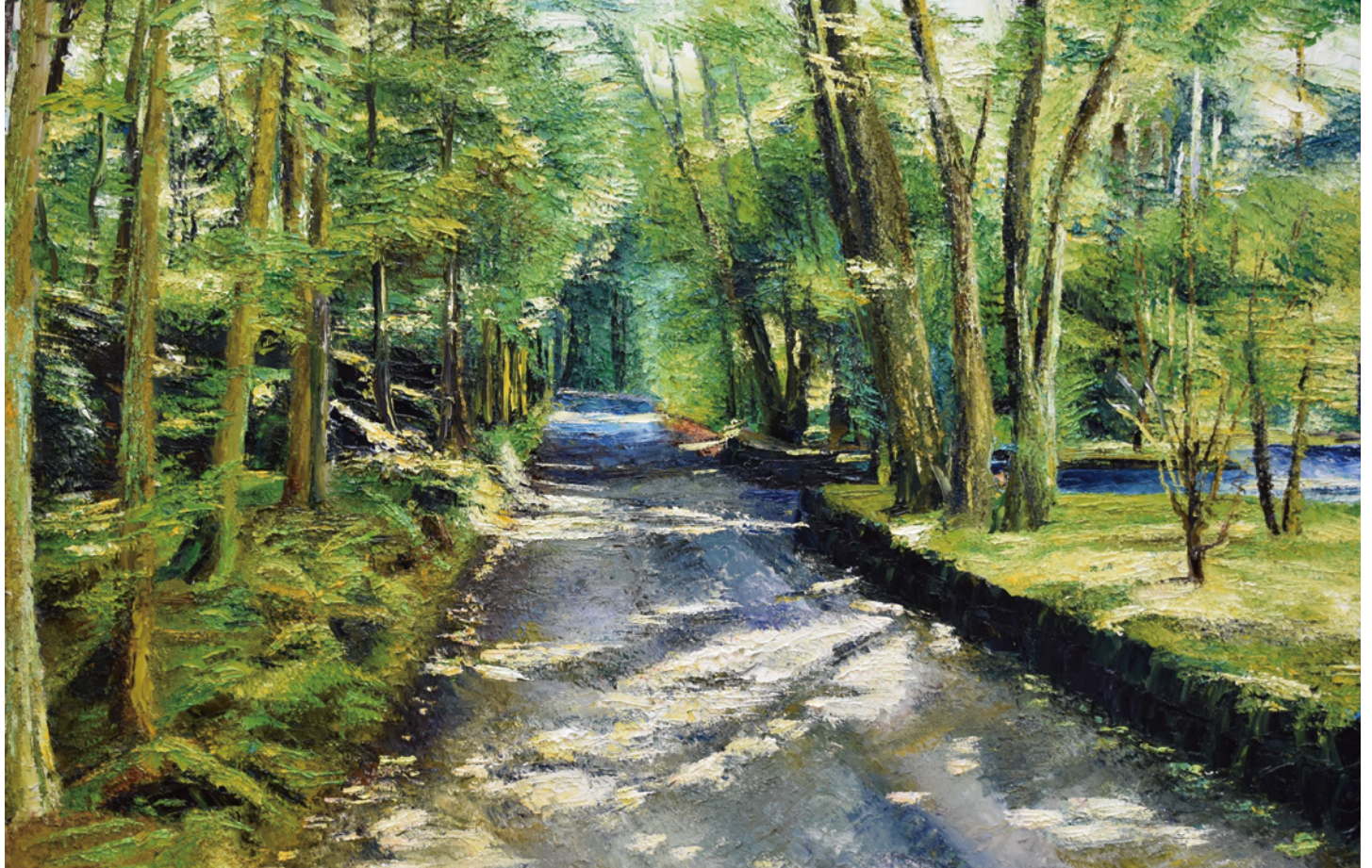
“木漏れ日の小道” 91 × 116 cm