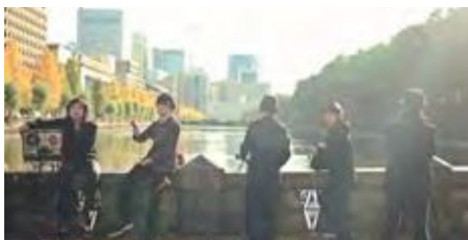
7 Open Reel Ensemble × 拠点