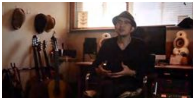
2 no.9 × リサーチパーク