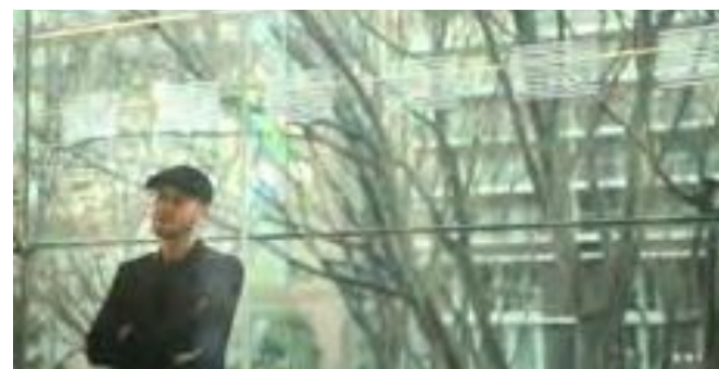
6 blanc. × グローバル・スペシャリティファーマ