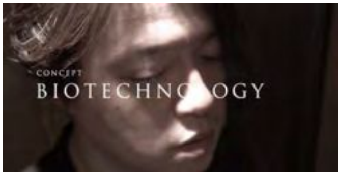
1 渋谷慶一郎 × バイオテクノロジー