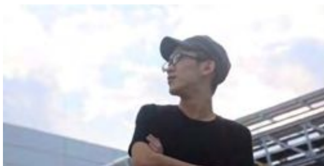
4 JEMAPUR × 生産技術