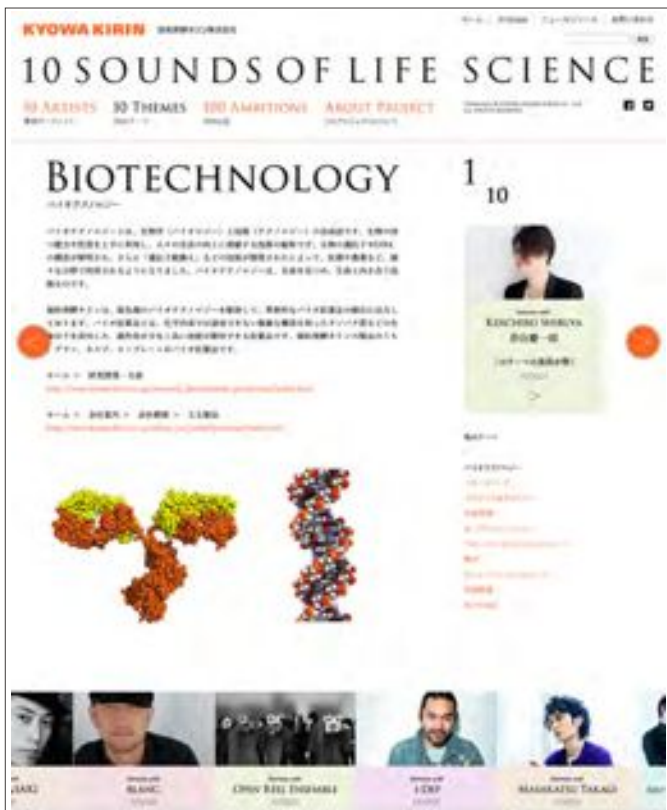
「10 THEMES」：各テーマの詳細をご紹介します。