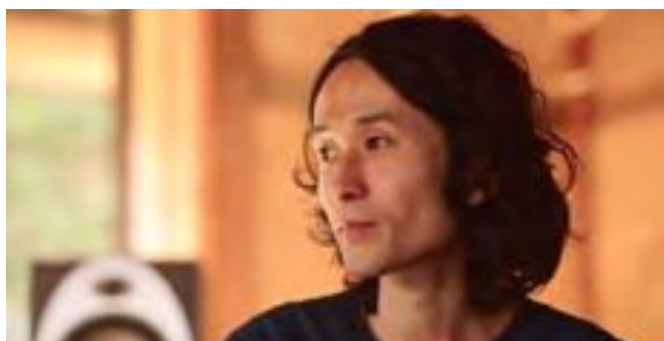
9 高木正勝 × 抗体医薬