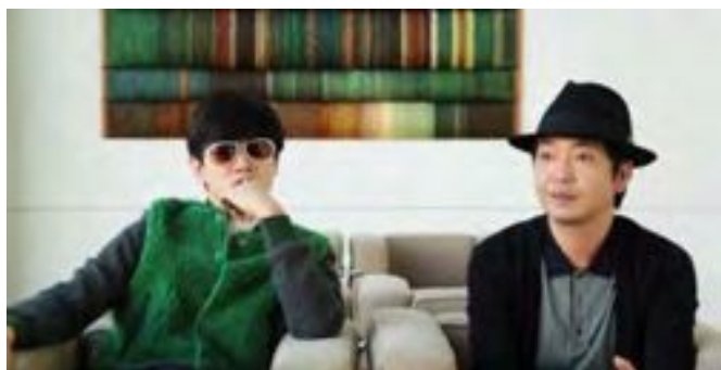
3 STUDIO APARTMENT × ビジネス&クオリティ