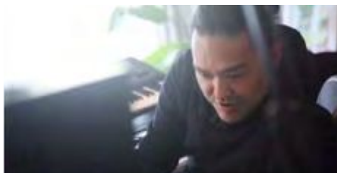
8 i-dep × アンメット・メディカルニーズ