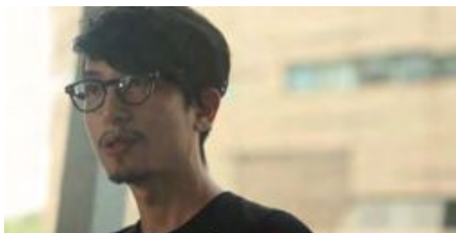
5 DJ KAWASAKI × オープンイノベーション