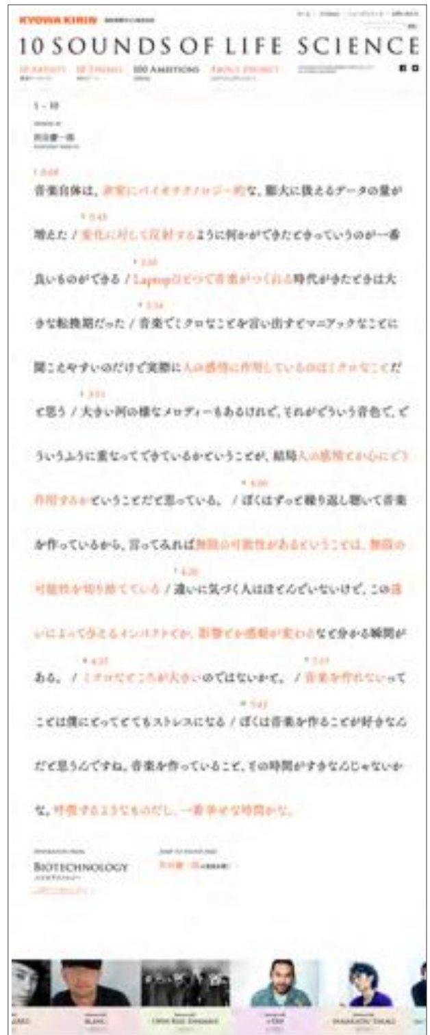
「100 AMBITIONS」：10の言葉をお楽しみいただけます。