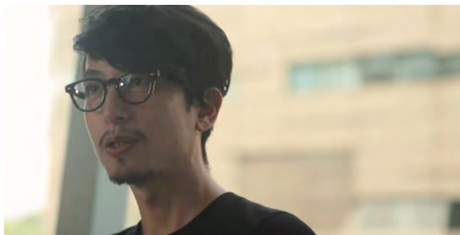
5 DJ KAWASAKI × オープンイノベーション