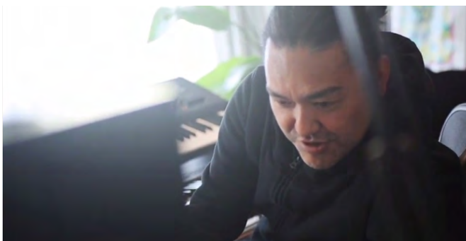
8 i-dep × アンメット・メディカルニーズ