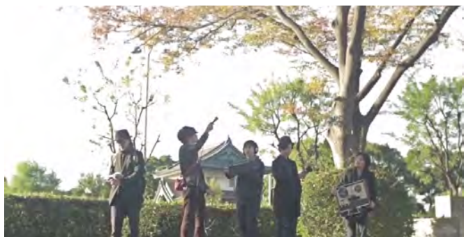
7 Open Reel Ensemble × 拠点