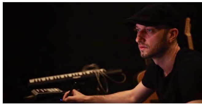
6 blanc. × グローバル・スペシャリティファーマ