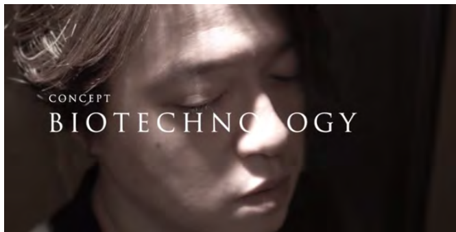
1 渋谷慶一郎 × バイオテクノロジー