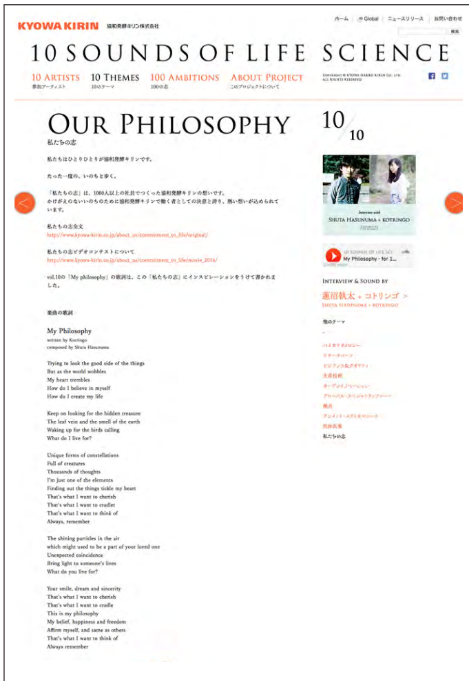
「10 THEMES」：各テーマの詳細をご紹介します。