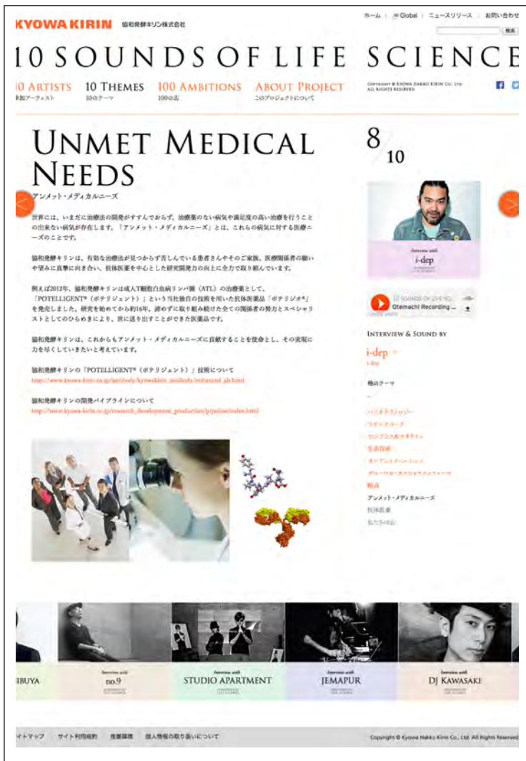
「10 THEMES」：各テーマの詳細をご紹介します。