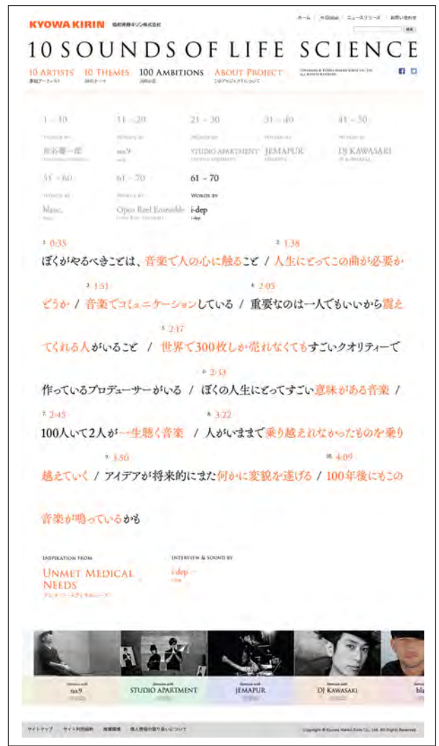
「100 AMBITIONS」：i-depの10の言葉をお楽しみいただけます。