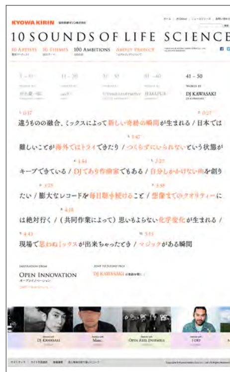
「100 AMBITIONS」：DJ KAWASAKI氏の10の言葉をお楽しみいただけます。