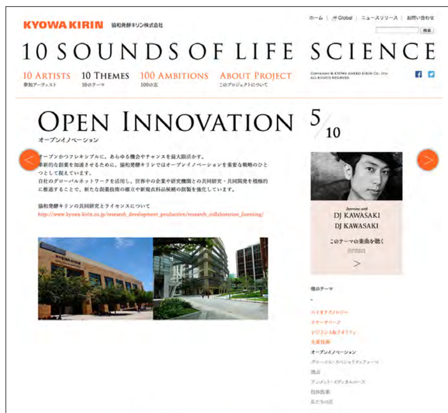
「10 THEMES」：各テーマの詳細をご紹介します。