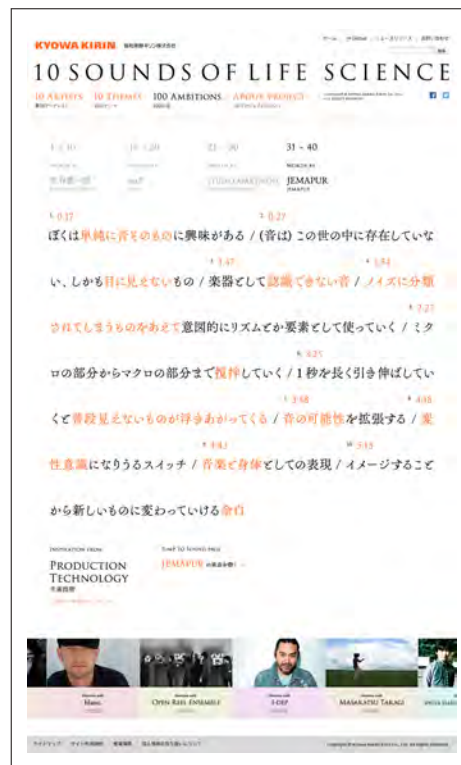
「100 AMBITIONS」：JEMAPURの10の言葉をお楽しみいただけます。