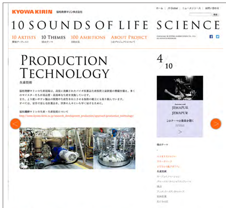
「10 THEMES」：各テーマの詳細をご紹介します。