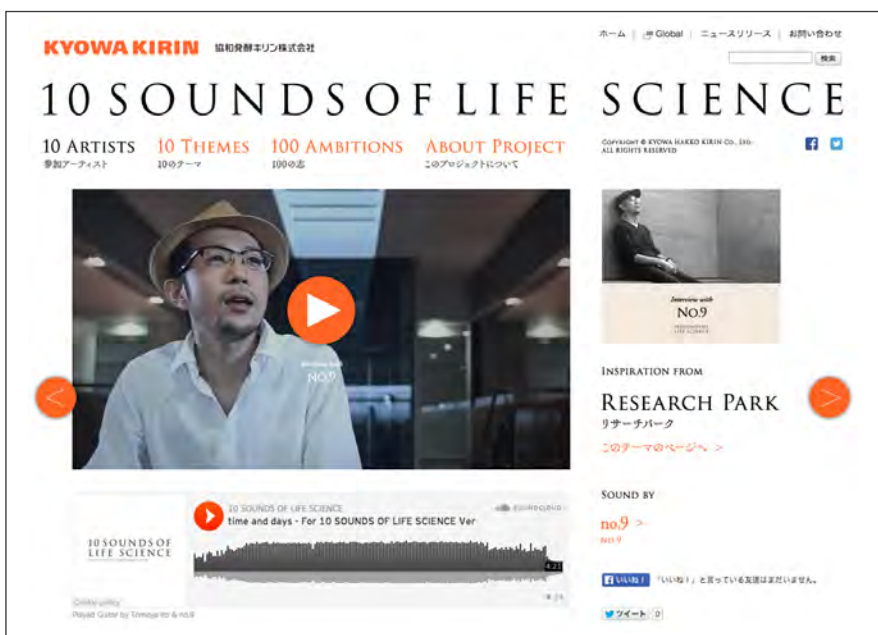
「10 ARTISTS」：no.9氏による新曲の視聴・ダウンロード、インタビュー映像をご覧ください。

インタビューから導きだされたno.9氏の「10の言葉」を公開します。気に入った言葉をクリックするとSNSでシェアいただけます。