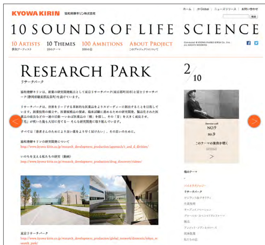
「10 THEMES」：各テーマの詳細をご紹介します。