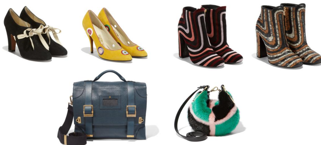
「銀座本店限定スペシャルコレクション」一例

また、最新アイテムが揃った「フェラガモズ・クリエイションズ」をはじめ、メンズシューズの最高級ライン「トラメツザ」の限定カラー、カクテルバッグやミラノコレクションに登場したシューズなどにも、日本では銀座本店のみの取り扱いとなる商品が数多く登場します。