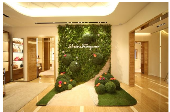
特設フォトブース