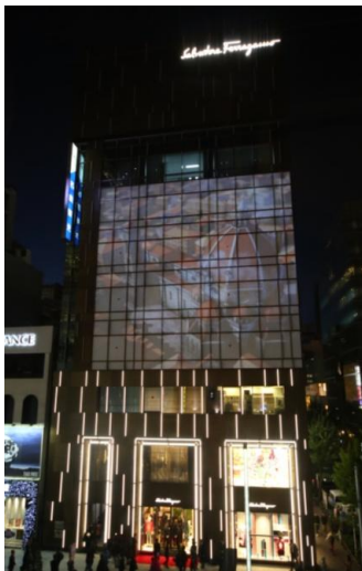
プロジェクションマッピング