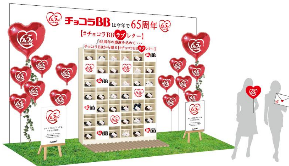
「#チョコラBB ラブレター」ブースイメージ

さらに、「8 月 8 日はチョコラBB の日」にちなんで、8 月 5 日(土)~8 日(火)には、ハッシュタグ「#チョコラBB ラブレター」をつけて Twitter または Instagram に「チョコラBB®」ドリンクやラブレター等の写真画像と一緒に返事をご投稿いただくと、抽選で「チョコラBB® スパークリング」12 本セットを 8 名様、「チョコラBB® Fe チャージ」10 本セットを 8 名様にプレゼントする「#チョコラBB ラブレター」お返事投稿キャンペーンも実施します。