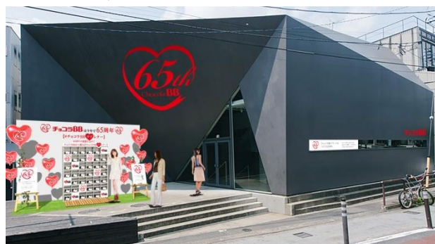
メイン会場イメージ