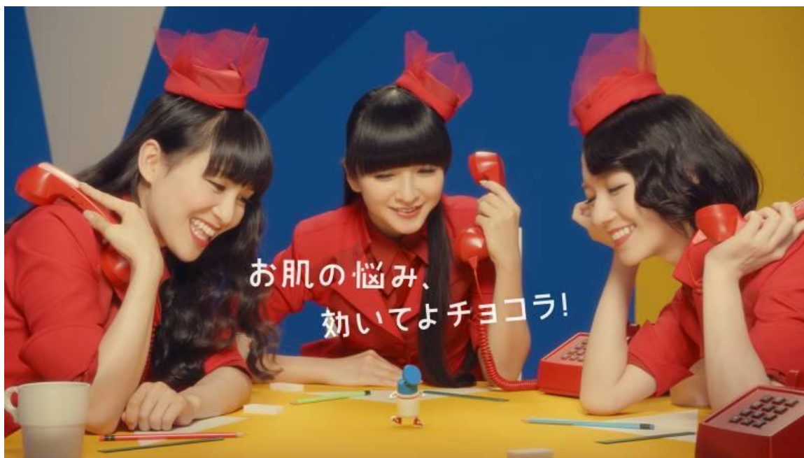
チョコラBB プラス「効いてよ チョコラ！」篇

「チョコラ BB プラス」の TVCM「効いてよ チョコラ！」篇は「GOOD チョコラ MORNING」篇の続篇で、2 つの CM ストーリーはつながった内容となっています。Perfume の 3 人が、電話で寄せられる肌あれ・にきび・口内炎などのお悩みを聞く“相談員”を演じています。「チョコラ BB」のテーマカラーでもある赤の制服を身にまとった 3 人が、電話でお悩みを聞いていると、「チョコラ BB プラス」のパッケージから何かが飛び出します。飛び出してきたのは、「チョコラ BB プラス」の化身「チョコラくん」。TVCM 初登場となるチョコラくんは、Perfume の 3 人から「お肌の悩み、効いてよ チョコラ！」と頼まれると、その悩みを一手に引き受けることに。ここには、“肌あれ、にきび、口内炎には「チョコラ BB プラス」というメッセージが込められています。電話でお悩みを受けるシーンの撮影では、アドリブのお芝居を披露するなど、お肌の悩み相談員になりきっていた 3 人。ラストシーンの巨大な「チョコラくん」社長の登場で見せる表情も注目です。Perfume の 3 人と新キャラクターのチョコラくんとの掛け合いが見所の TVCM です。