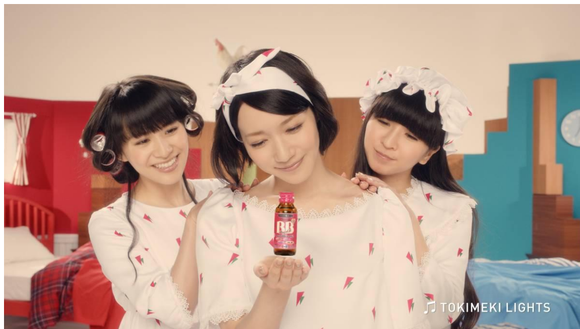
チョコラ BB ローヤル 2 「GOOD チョコラ MORNING」 篇

「チョコラ BB ローヤル 2」の TVCM「GOOD チョコラ MORNING」篇では、Perfume の 3 人が起きてから家を出るまでを描いています。ストーリーは朝、威勢の良い“コケッコー！”というニワトリの鳴き声に気付かずにごっすりと眠る 3 人の寝顔のアップからスタート。ようやく目覚め、パジャマ姿でベッドから起き出すもスッキリせずお疲れの様子。すると、そんな 3 人にピッタリの「チョコラ BB ローヤル 2」が登場します。