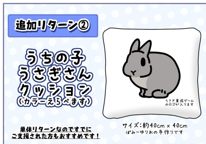
うちの子うさぎさんクッション

ゲームに登場予定のうさぎのデザインの中から支援者が好みのうさぎを選ぶことができます。どちらのリターンもほみーゆりおが真心を込めて手作りするグッズとなります。