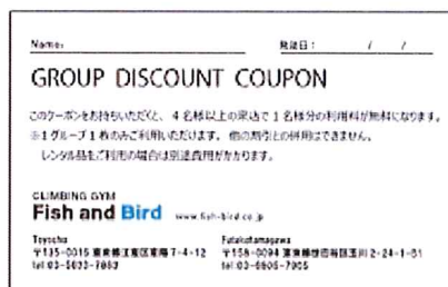
グループ割カード（イメージ）