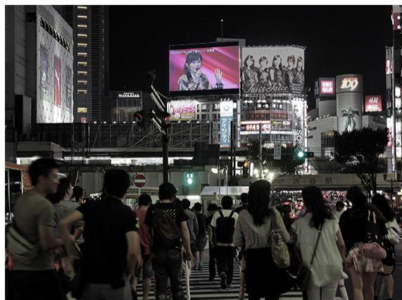
【シブハチヒットビジョンでのAKBライブ生中継模様】 宮益坂から撮影