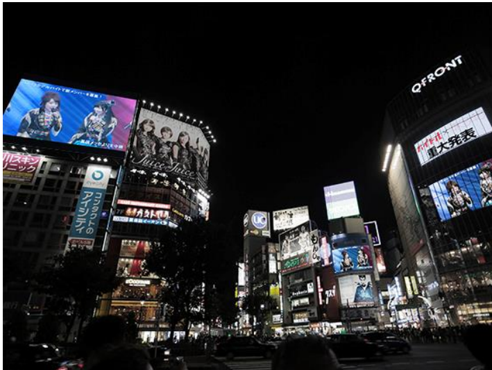
【シブハチヒットビジョンでのAKBライブ生中継模様】 渋谷駅ハチ公口広場から撮影

ヒットは今後も、「シブハチヒットビジョンを見て得した!」と渋谷来街者が感じるような広告、映像を発信する企画を進めて参ります。