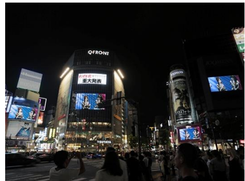
【周辺4ビジョンでのAKBライブ生中継模様】