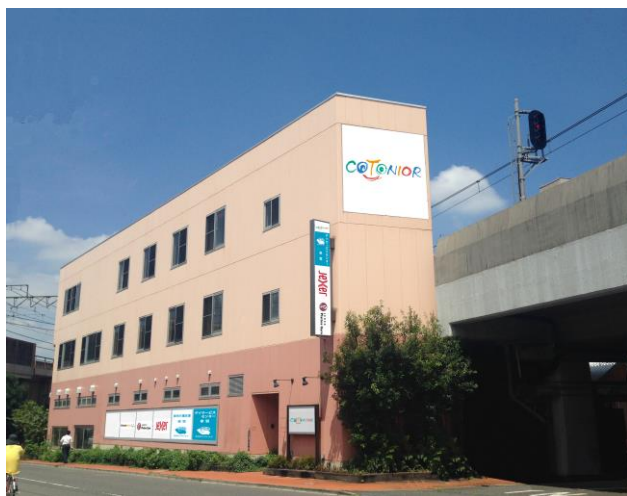
COTONIOR (コトニア) 赤羽 外観