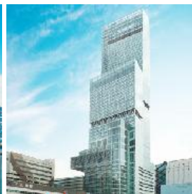
大阪マリオンネット 都ホテル(大阪)