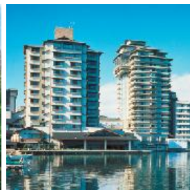
和倉温泉 加賀屋(石川)