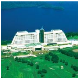
ザ・ウィンザーホテル洞爺 リゾート&スパ(北海道)