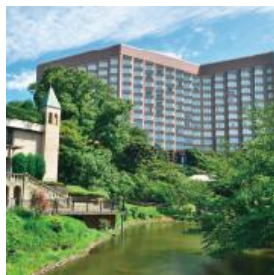
ホテル椿山荘東京 (東京)