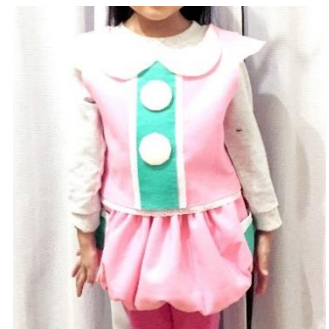
<スカートなどの衣装制作>