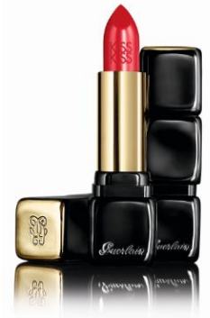
KISSKISS (325 ルージュ キス)

「ラ プティット ローブ ノワール」、「KISSKISS」を始めとしたゲランの“気分着替え”アイテムは、全国の有名百貨店ゲランコーナー、直営店ゲランブティック、サロンにて販売しております。