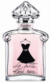
ラ プティット ローブ ノワール (オーデトワレ)

ドレスの裾が、 ふわりと風になびくように軽やかなフレッシュ フローラルの香調 。トップにはフェミニンなローズやジャスミンの花々が広がり、チェリーやアップル、ブラックカラントが続きます。ラストはホワイトアンバー、ホワイトムスクが優しく包み込み、まとう人を一層輝かせ、誰からも愛される、さらに魅力的な女性へと変身させます。