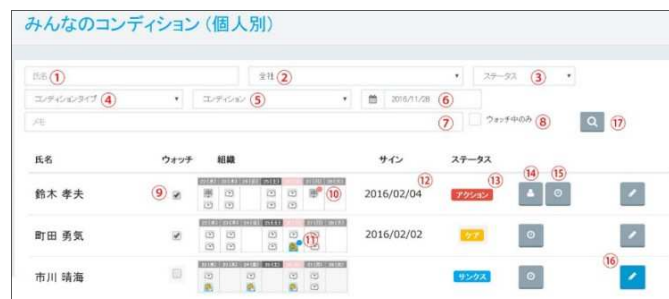
②「みんなのコンディション」画面