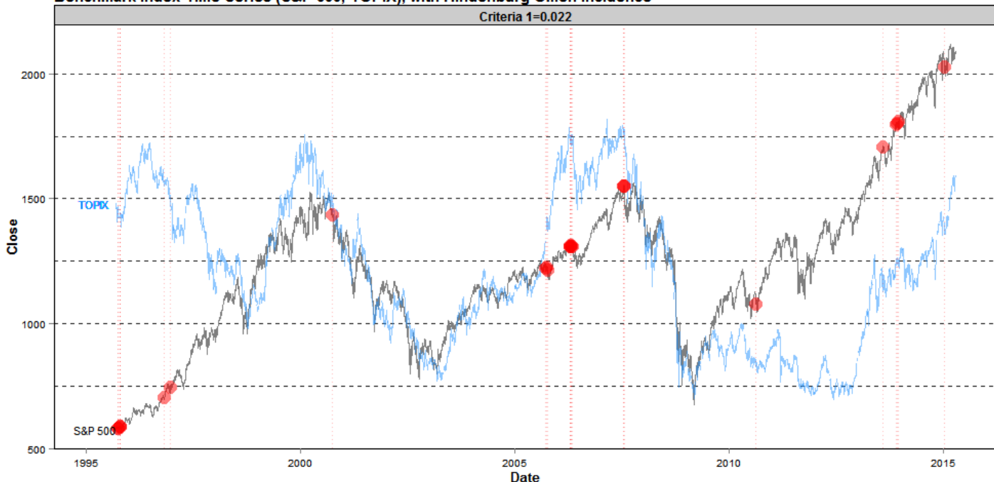
Benchmark Index Time Series (S&P 500, TOPIX), with Hindenburg Omen incidence

ヒンデンブルグオーメン インディケーターを利用したeワラントの投資方法には、例えば以下のようなものが考えられます。なお、株価指数を対象原資産とするeワラントには、例えばTOPIXeワラントやダウ・ジョーンズ工業株価平均eワラントが取引できます。