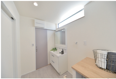
↑家事動線抜群の広い洗面