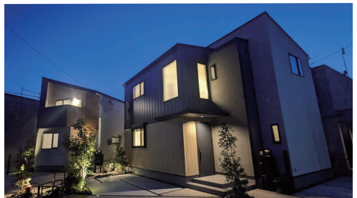
照明計画にもこだわり、夜間の街並みにも上質な雰囲気演出(右から14号地・13号地)