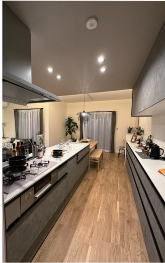
幅 3.6m の大型収納↑