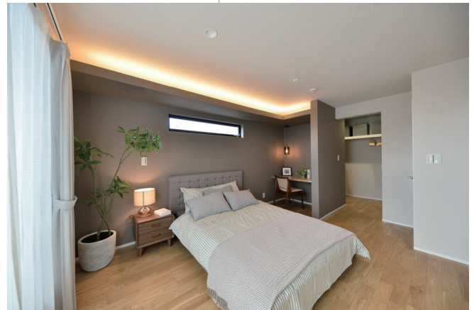
↑書斎コーナー、大容量のウォークインクローゼットを備える