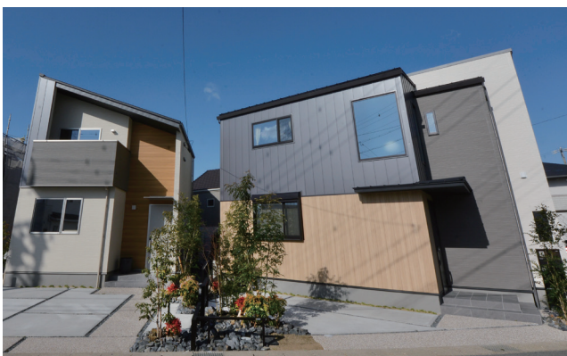
金属や窯業サイディング、タイルなど、多種類の素材を使用したスタイリッシュな外観(右から14号地・13号地)