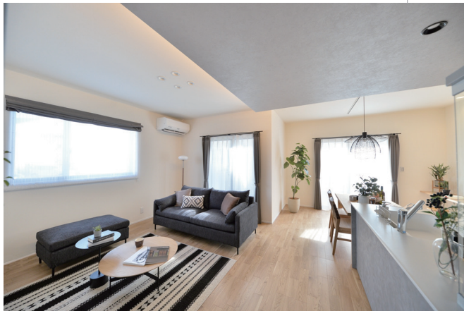
↑窓を多く配置した20帖を超えるLDK