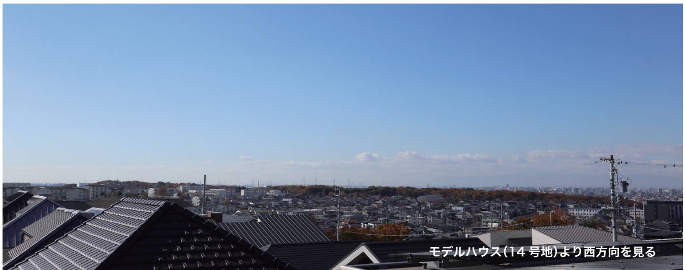
モデルハウス(14号地)より西方向を見る