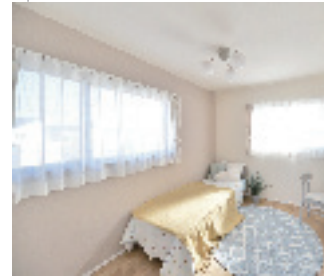
↑2面彩光の明るい居室