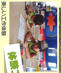
楽しい工作体験 ※遊園のケーブルバス・体験工房は8月末で終了いたします。