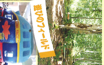
ふわふわケーブルバス