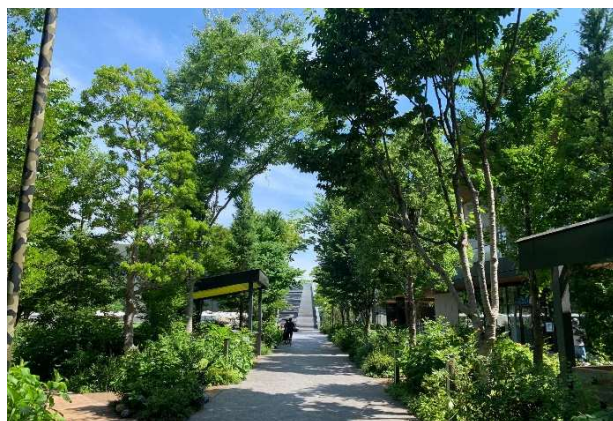
▲木立を抜ける通路