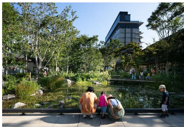
▲イベント広場からビオトープを望む