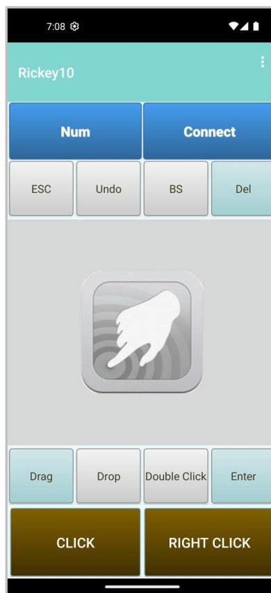
タッチパッド画面