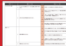
■ 課題一覧 類似発見点をグルーピングし、課題を抽出したレポートです。