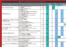
■ ユーザ別の発見点一覧 ユーザごとに、発見点をまとめた一覧表です。