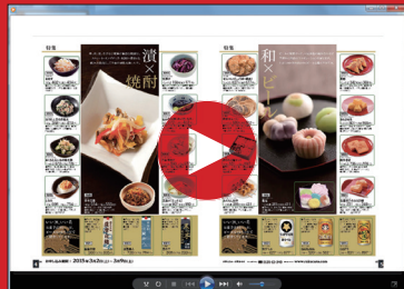
■ 動画 (約60分/1名) 各モニタのテスト動画です。