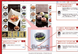
■ 発見点*マップ 紙面 (ページ) ごとに、発見点を図解したマップです。