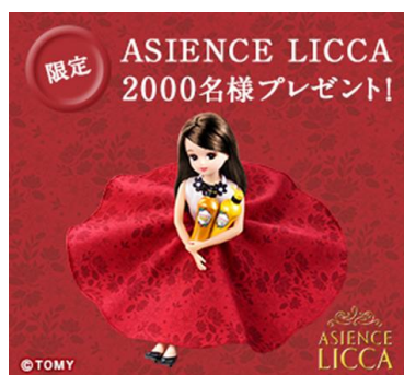
ASIENCE 限定リカちゃんボトル (シャンプー&コンディショナー)

「ASIENCE（アジエンス）」は、「リカちゃん」とコラボレーションした、限定リカちゃんボトルのアジエンスを6月上旬より店頭販売します。また、対象商品を購入して応募すると抽選で2,000名様に「ASIENCE LICCA」(ドールセット)が当たるキャンペーンを実施中です。