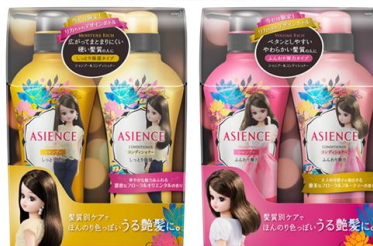
しっとり保湿タイプ