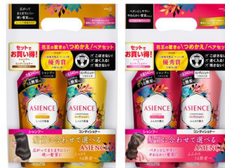
しっとり保湿タイプ