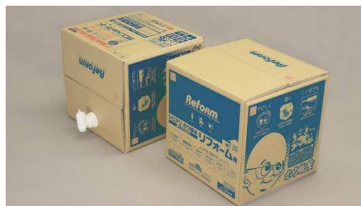
シロアリホウ酸水 リフォーム用™