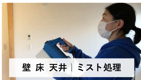
壁 床 天井 | ミスト処理

次亜塩素酸が菌やウイルス、臭いの元となる有機物に触れると瞬時に分解し、水になります。残効性はありません。