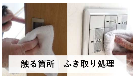
触る箇所 | ふき取り処理

しかし、COVID-19 と同じタイプ（エンベロープウイルス、RNA ウイルス）であるインフルエンザウイルスに対する抗ウイルス活性は確認（次亜塩素酸 40ppm）されており、同じく有効であると推察されています。また、さらに抵抗性が高いノロウイルス（ノンエンベロープウイルス、RNA ウイルス）への抗ウイルス活性も確認（同 40ppm）されています。