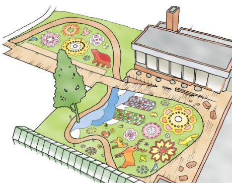
*この画像は2018年のデザインイメージです。

ザ・タワーの中庭、約700平方メートルの面積に花びらで模様を描いた景色が広がります。2018年は、花びらで描く模様は花の形に加え、ザ・タワーと雲海テラスからの景色、北海道になじみの深い動物、エゾシカやヒグマも登場します。雲海は5月中旬から10月中旬頃に気象条件によってトナムで見られる景色で、エゾシカなども当リゾートの敷地内で見られる動物です。昨年よりもさらに、トナムを表現したデザインです。