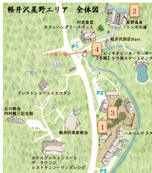
*図上の1～4は、次ページの内容の場所を表します。

軽井沢は、東京から約1時間の立地でありながら、豊かな自然にあふれ、気軽に日常から離れられる場所として人気を得ています。特に冬は、一人の時間を過ごすのにふさわしい、適度な静けさがある季節です。そして、軽井沢星野エリアでは、温泉を中心に、食事や自然も満喫できます。本プランは一人旅を楽しむきっかけになります。