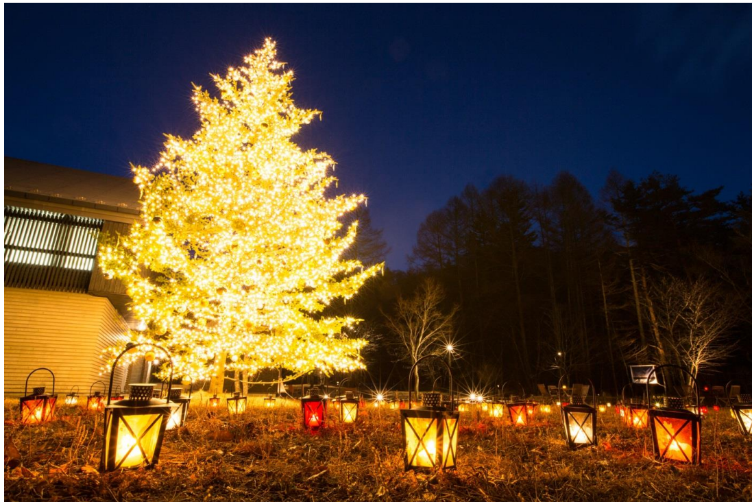
イルミネーションが輝く、高さ10mの本物のもみの木がシンボルツリー

星野リゾートが運営する日帰り商業施設「軽井沢星野エリア」では、2017年11月19日～12月25日に、クリスマスイベントとして「クリスマスタウン軽井沢」を開催します。軽井沢の自然の中に、この時期だけ現れる街「クリスマスタウン」では、美しいイルミネーションのもと、様々なイベントが行われます。8年目の開催となる本年は「ほほ笑みゆきかう小さな街」がテーマです。高さ10メートルのシンボルツリーを中心に、イルミネーションや ギフト、ワインやスイーツなど、クリスマスには欠かせない要素が揃います。恋人同士はもちろん、家族や気のおけない仲間と、クリスマスを笑顔で過ごせます。