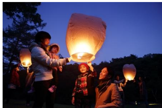
みんなの想いをひとつにして、 夜空に浮かべるスカイランタン