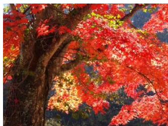
モミジの紅葉 見頃:10月中旬～下旬

軽井沢星野エリアには、木々の葉が赤く染まる紅葉に加え、黄色に色づく黄葉も多く見られます。紅葉の代表はモミジやツタウルシです。真っ赤に染まった葉が幾重にも重なり、鮮やかな景色を創り出します。また、黄葉するカラマツは、信州で目にすることの多い木で、風によって雨が降るように散る細やかな葉が、日の光を浴びて黄金色に輝く様子は息をのむような美しさです。