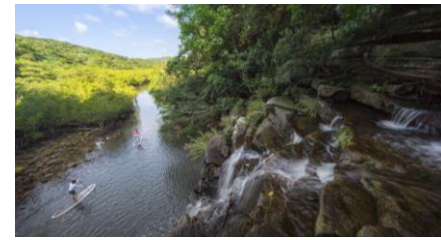
SUPで川下り(イメージ)