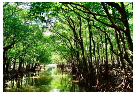
カヤックでマングローブの森を散策 (イメージ)