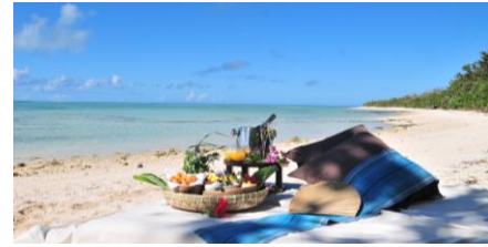
ビーチでのランチタイム(イメージ)